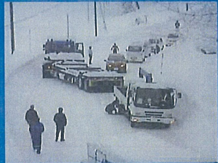
国道8号 新潟県柏崎市五十土地先 平成24年1月27日