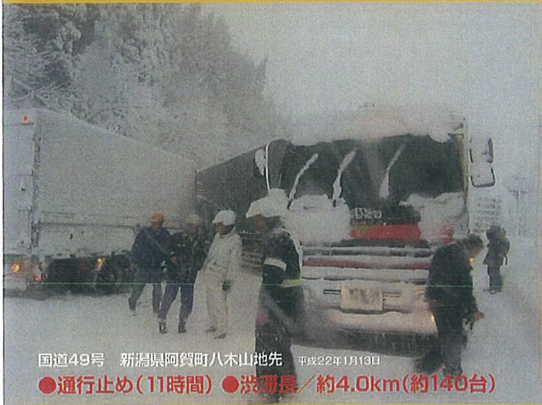
国道49号 新潟県阿賀町八木山地先 平成22年1月13日 ●通行止め(11時間) ●渋滞長/約4.0km(約140台)