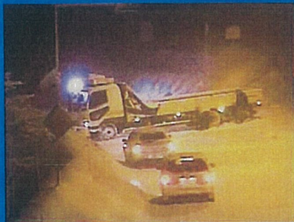
国道49号 新潟県阿賀町鳥井地先 平成22年1月13日