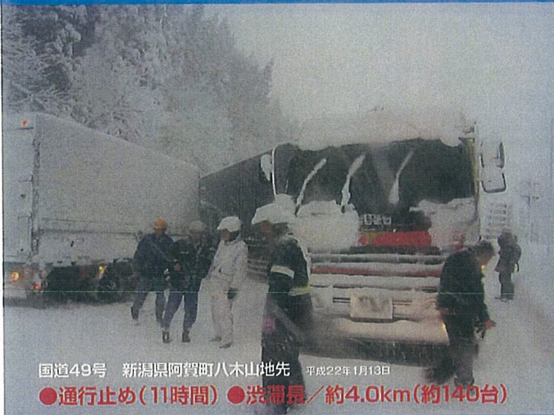
国道49号 新潟県阿賀町八木山地先 平成22年1月13日 ●通行止め(11時間) ●渋滞長/約4.0km(約140台)