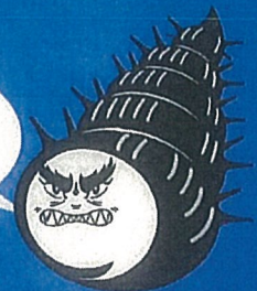
チェーン巻いたん貝