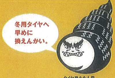
タイヤ換えたん貝

大型車のスリップ・立ち往生をきっかけに、 長時間の通行止めが発生しています。 冬用タイヤの交換・早めのチェーン装着を よろしくお願いします。