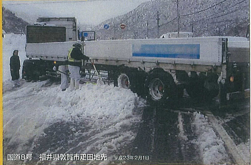
国道8号 福井県敦賀市疋田地先 平成23年2月1日

大型車のスリップ・立ち往生をきっかけに、 長時間の通行止めが発生しています。 冬用タイヤの交換・早めのチェーン装着を よろしくお願いします。