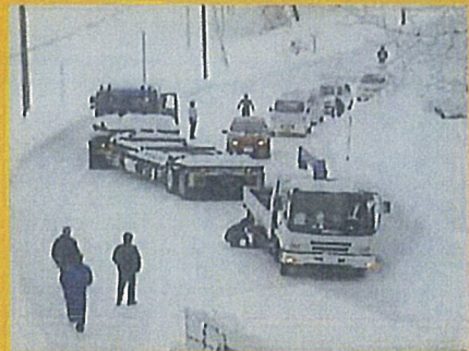
国道8号 新潟県柏崎市五十土地先 平成24年1月27日