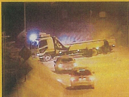
国道49号 新潟県阿賀町鳥井地先 平成22年1月13日