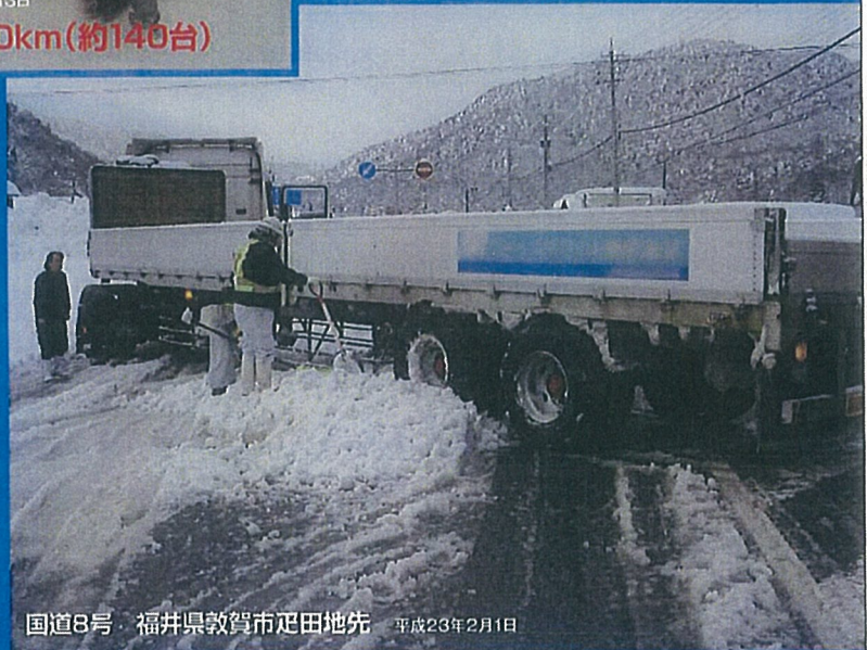
国道8号 福井県敦賀市疋田地先 平成23年2月1日

大型車のスリップ・立ち往生をきっかけに、 長時間の通行止めが発生しています。 冬用タイヤの交換・早めのチェーン装着を よろしくお願いします。