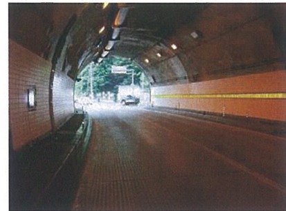
(当事車両からの見通し)