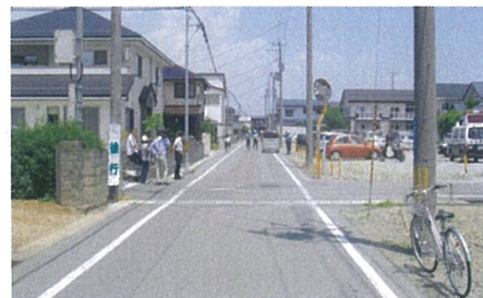
(Aの進行方向からの見通し)