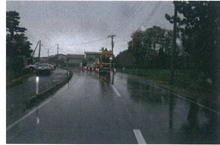
(A車両からの見通し)