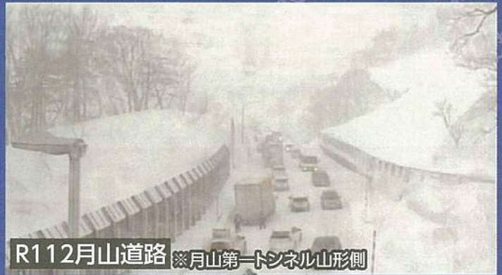
R112月山道路 ※月山第一トンネル山形側