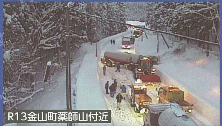
R13金山町薬師山付近