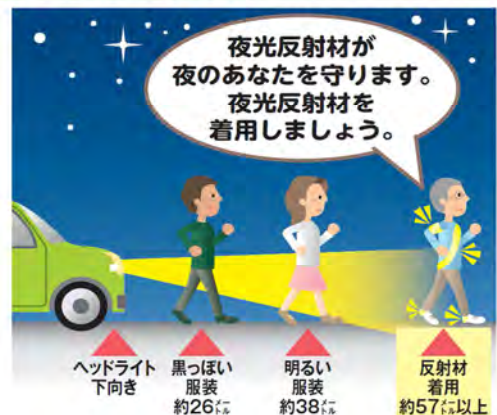
イラスト 山形新聞社提供