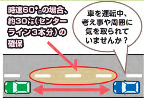
イラスト