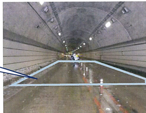
【A進行方向からの見とおし】