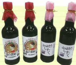
山ぶどうジュース