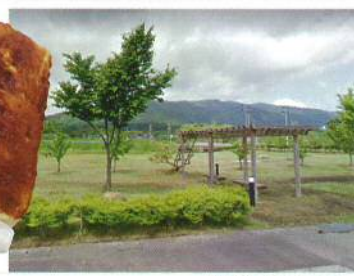
隣接した河川公園