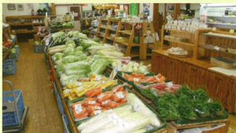
九戸村の特産品が品数豊富に並ぶ「オドデ館」