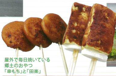
屋外で毎日焼いている 郷土のおやつ 「串もち」と「田楽」