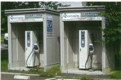
EV充電器 急速充電器を2台設置