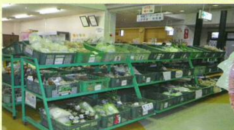
朝取り新鮮野菜を始め、村田町の特産品が豊富に並ぶ。