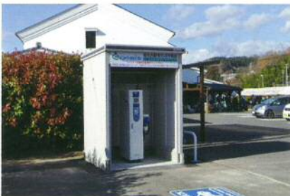
EV充電器 急速充電器を1台設置