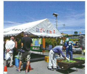
毎年6月に開催される「そら豆まつり」

[路線名] 主要地方道亘理大河原川崎線 [所在地] 宮城県柴田郡村田町大字村田字北塩内41 [電話] 0224-83-5505 [営業時間] 9:00~17:00 [休館日] 月曜日(祝日の場合はその翌日)・12月31日~1月2日