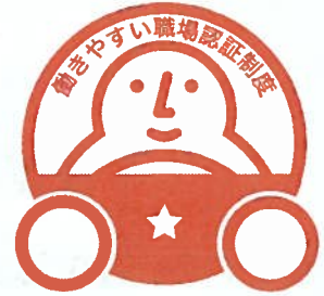
「一つ星」認証マーク

申請受付・認証業務は、国土交通省から、本制度の実施団体に選定された「一般財団法人日本海事協会（通称：ClassNK）」が行います。