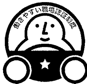
「一つ星」認証マーク