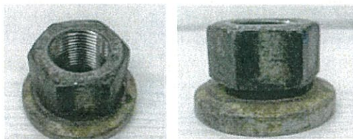
車輪脱落事故を起こした車両の ワッシャー付ホイール・ナット

このため、大型車のタイヤを脱着する際は、ホイール・ナットを清掃した上で、ナットとワッシャーの間を含めて適切に潤滑剤を塗布するとともに、劣化したホイール・ナットは必ず交換をお願いします。