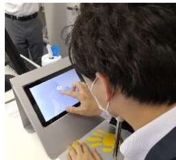
タブレット型視野計