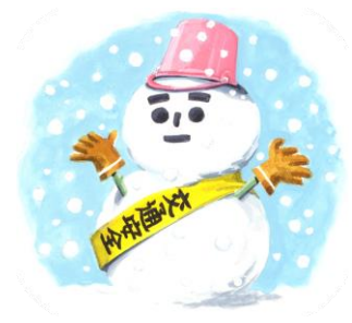
(飲酒運転撲滅ポスター)