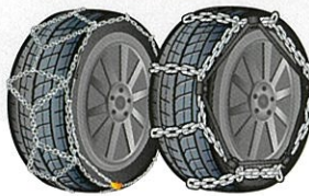
大型車用金属チェーン

残り溝深さが「フラットホーム」に達している状態。冬用タイヤとして使用できません。