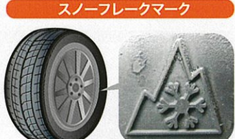
スノーフレックマーク